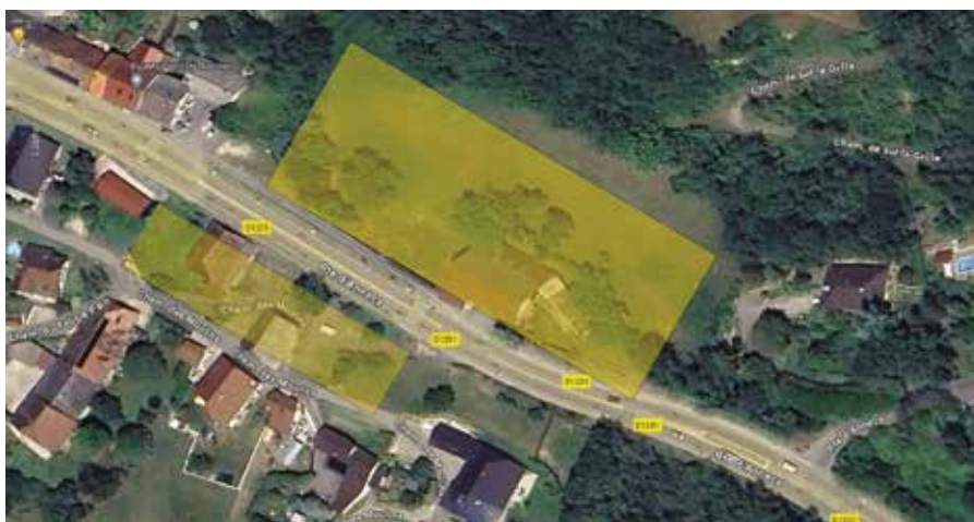
Entrée de Jussy et terrain propriété communal

Le conseil municipal en place a souvent informé de son désir fort de proposer un ou des services à nos aînés, à ceux à venir, un accès aux commerces et à la santé pour le plus grand nombre. Aussi, il est étudié un projet de maison médicalisée avec médecin généraliste, spécialiste, une pharmacie, une épicerie, une structure d'accueil permettant des logements médicalisés et aidés. Permettre une fin de vie chez soi avec le maximum d'indépendance tout en favorisant une vie en collectivité qui