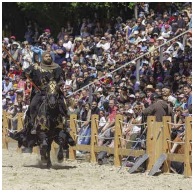
Les Grandes Médiévales d'Andilly

acteur touristique majeur de notre territoire, encouragé également par l'État, la Région et le Département. Il est devenu aussi un acteur social au profit de jeunes de la région proche, avec un volet caritatif de surcroît. Enfin, l'originalité et la qualité des constructions en font un acteur du patrimoine, encourageant l'activité et la pérennité d'anciens métiers.