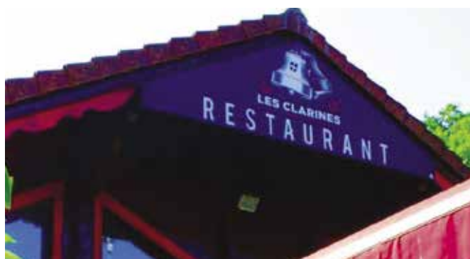
L'enseigne du restaurant

Et l'animation n'est pas en reste puisque de nombreux rendez-vous sont donnés pour des soirées à thème selon la période : championnat de rugby, karaoké, halloween.... Et si