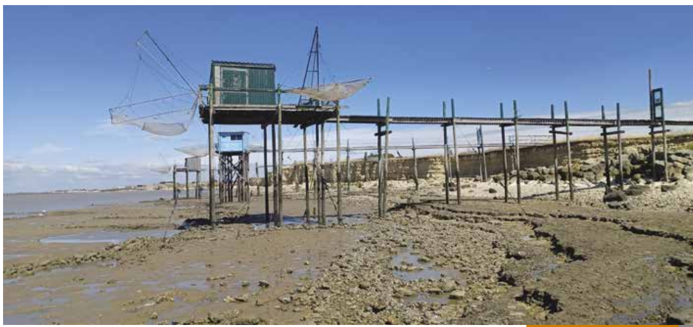
La Baie d'Aiguillon

Ce jumelage a permis des échanges entre les élus municipaux qui se poursuivront. Il s'agit maintenant d'encourager les habitants andillois et andillais à se rencontrer pour découvrir deux régions dotées d'atouts en termes de paysages et de patrimoine. Il peut être intéressant d'initier également des échanges scolaires. N'hésitez pas à contacter les conseillers municipaux à ce sujet.