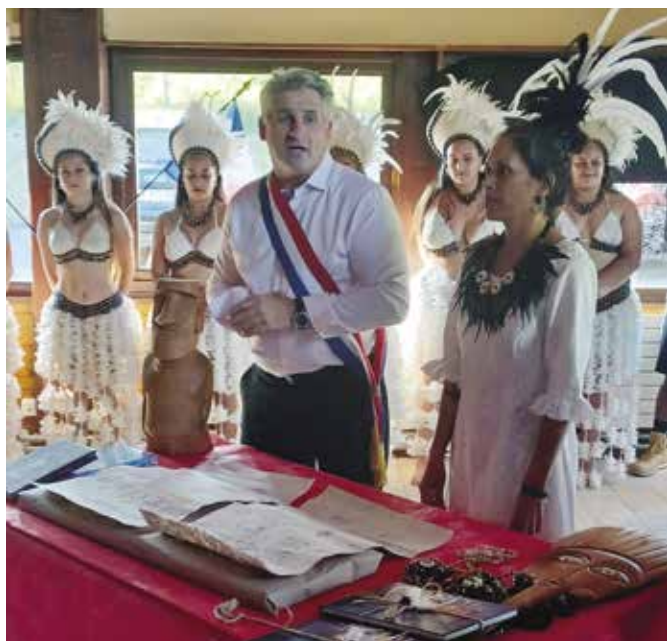
Cérémonie de Jumelage à Andilly avec Hanga Roa (île de Pâques)