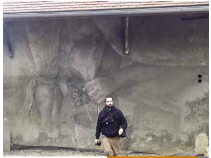
La fresque "Fenêtre sur Paysage"

Le ruban inaugural de l'auberge a été coupé pour une autre réalisation, à savoir une double fresque faite par un artiste sicilien Alberto Ruce sur la façade nord du bâtiment et Place Bijou. Ce projet dit « fenêtre sur le paysage » est piloté par l'association « Derrière le hublot » ayant pour