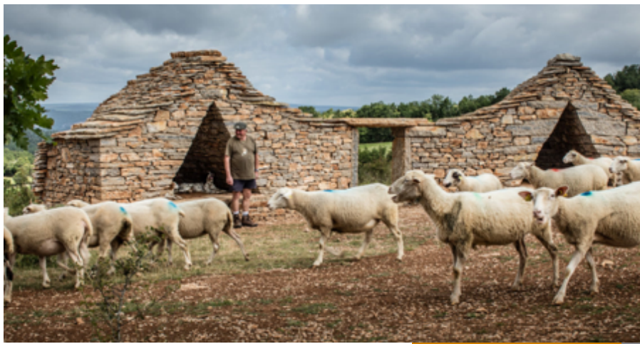
Œuvre refuge de Gréalou 46160

Dans un but de mise en tourisme et de réappropriation par les habitants du chemin, le Territoire Usse & Bornes déploie depuis 2023 la démarche Fenêtres sur le paysage en Haute-Savoie. En découlent diverses animations – Constellations à la Ferme de Chosal avec l'AAPEI EPANOÛ, Le Miracle du Mouvement en forêt de Mar-