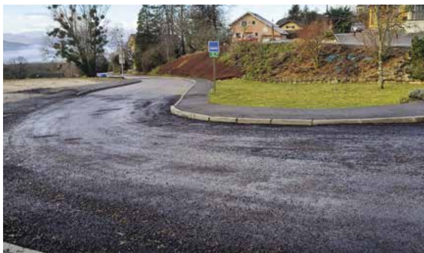
Route de Copponex

Depuis plus d'un an, la route de Copponex est soumise à un arrêté municipal d'interdiction de circulation automobile en aval de Saint Symphorien, aux heures de déplacements pendulaires des frontaliers.