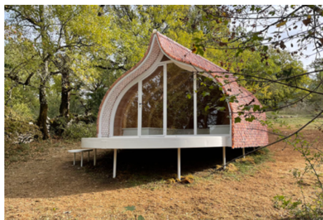
Œuvre refuge de Limogne en Quercy 46260