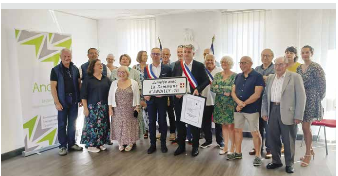
Cérémonie de Jumelage à Andilly les Marais

Comment faire ? Depuis plus de trois siècles, un réseau quadrillé de canaux sur des centaines de km a été creusé (à la pelle autrefois) avec des écluses permettant de régler le débit (à la main autrefois). Nous avons rencontré le « maître des eaux » qui préside l'association des Marais chargée de cette gestion et des travaux nécessaires. En février 2010, la tempête Xynthia tristement célèbre sur la côte vendéenne a permis à l'océan de rompre les digues littorales et inondé la baie de l'Aiguillon. Andilly-les-Marais a failli devenir Andilly-sur-Mer, la côte s'étant rapprochée à moins d'un kilomètre. L'eau salée est restée plusieurs jours sur les terres qu'il a fallu traiter avec du gypse pour pouvoir à nouveau cultiver. Une vingtaine de km vers l'intérieur, la menace n'existe plus et les canaux sont un atout touristique dans le Marais Poitevin et Vendéen où les embarcations de touristes glissent langoureusement et silencieusement sur l'onde.