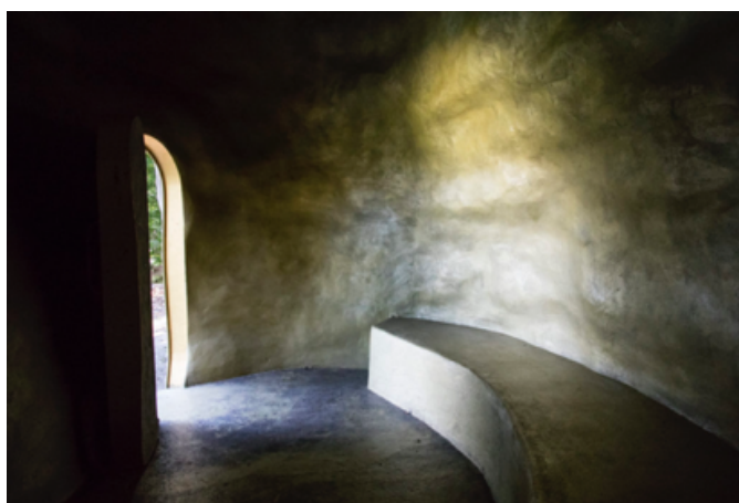
Œuvre refuge la Chambre d'Or Golinhac 12140

https://www.facebook.com/derrierelehublot12