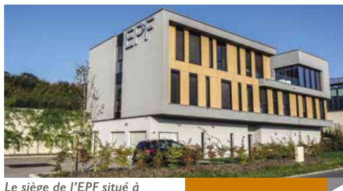
Le siège de l'EPF situé à Allonzier-la-Caille

L'EPF 74 est un véritable outil foncier, qui agit au nom et pour le compte des collectivités membres en matière de portage foncier et de conseil en stratégie foncière. La densification et le renouvellement urbain sont des enjeux essentiels à l'aménagement du territoire. Le périmètre d'intervention est en constante progression. Fin 2018, c'est près de 90%