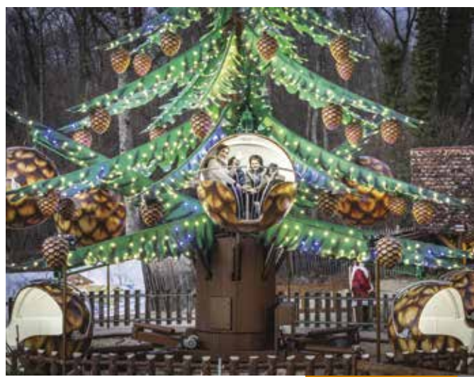
Le Grand Parc d'Andilly été/hiver (le manège)

Le Petit Pays a connu une forte croissance. Il est devenu un